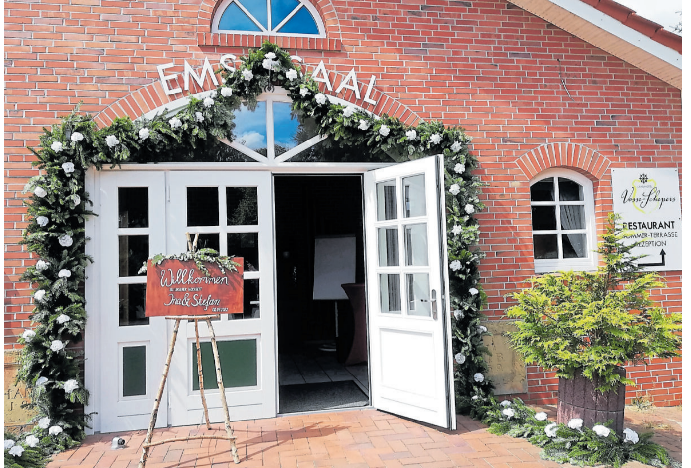
Der große Ems-Saal hat seit seinem Bestehen 1997 schon viele glückliche Brautpaare willkommen heißen dürfen.

nachbarlichen Gebäudes entstanden 1982 zwei Bundeskegelbahnen, welche viel Zuspruch fanden. Etliche Kegelclubs wurden neu gegründet und bestehende wechselten zu Vosse-Schepers nach Rhede.