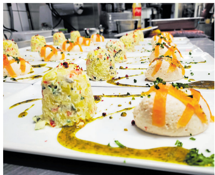
Viele Köstlichkeiten stehen auf der Speisekarte, zum Beispiel Lachs-Mousse mit Gemüse-Reis.