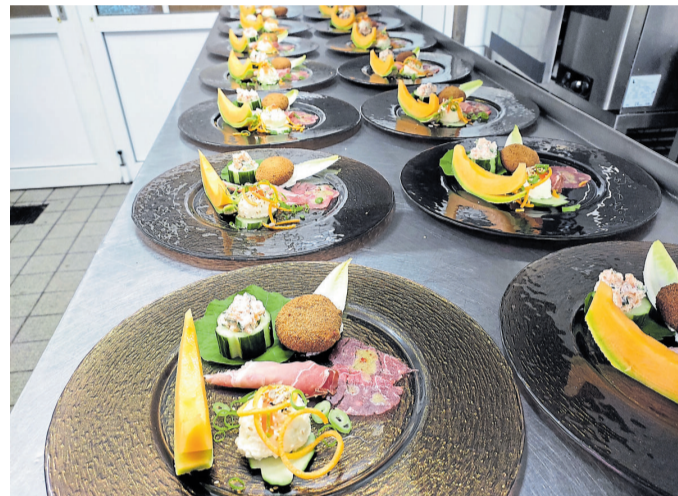
Erlesene Vorspeisen-Teller und exquisite Speisen.