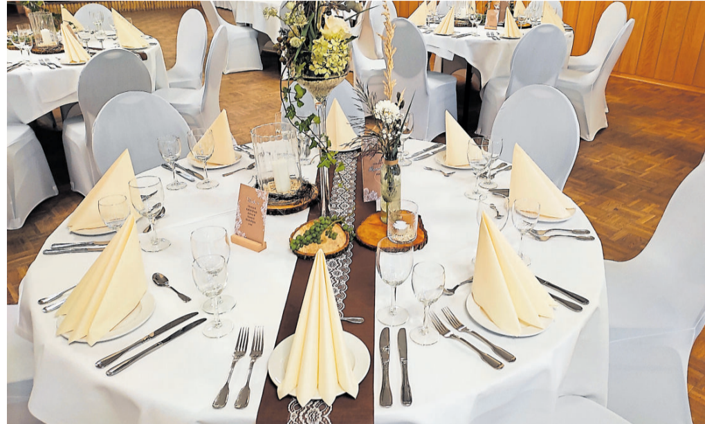
Festlich eingedeckte Tische im großen Ems-Saal.

Vor der Rezeption und vor dem Restaurant lädt eine Sonnen-Terrasse zum Verweilen ein. Hier kann man in aller Ruhe entspannen und sich des Lebens freuen. Das Landhotel Vosse-Schepers ist ein familiengeführter Betrieb. Und das spürt man auf Anhieb: Es steht immer ein Ansprechpartner zur Verfügung. Familie Vosse-Sche-