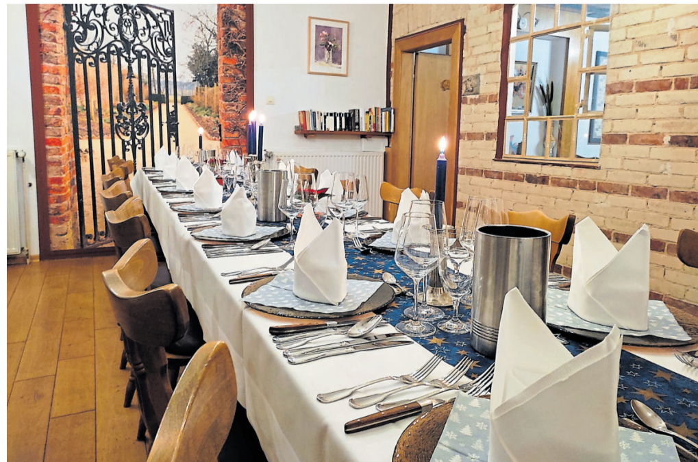
Ein bei Gästen beliebter Restaurantbereich ist die „Olle Käöke“.